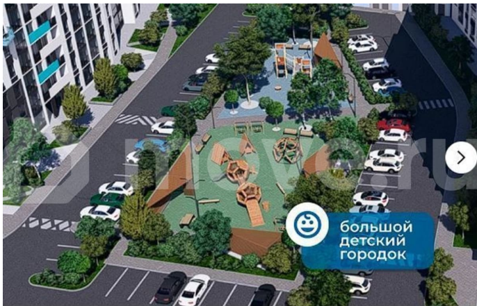
большой детский городок