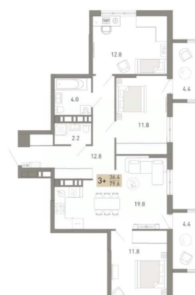
Подъезд 1 3-ком., 79.6 м²